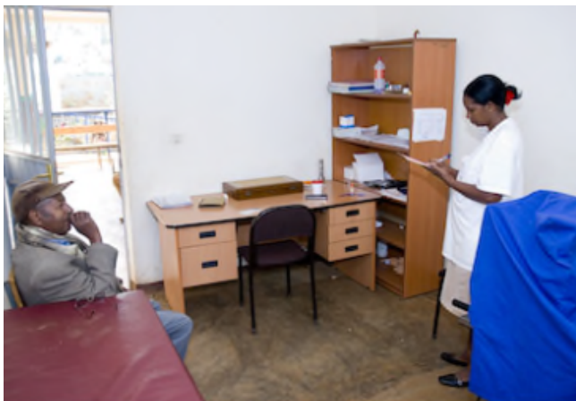
Salle de consultation

La mutuelle de santé offre une assurance qui couvre tous les services et les médicaments de base fournis dans les centres de santé locaux, ainsi qu'un nombre limité de services dans les hôpitaux de district et certains services dans les hôpitaux nationaux.