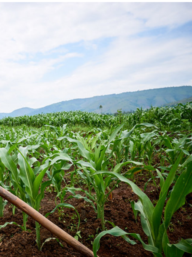
Bénéficiaire du PIMS en plein travail

Les pépinières leur ont également permis d'accéder aux fruitiers. De plus, grâce aux ateliers culinaires organisés dans le cadre du projet, les femmes ont appris différentes recettes qui leur permettent d'intégrer des aliments qu'elles ne cuisinaient pas auparavant (tels que les œufs).