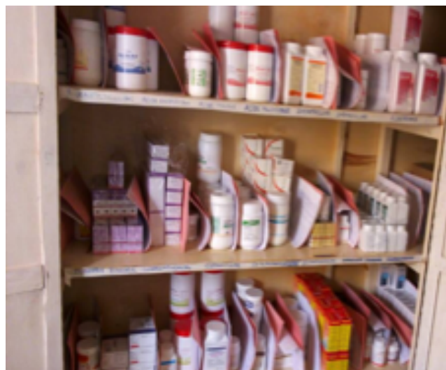
Une partie des médicaments financés par la commune de Kraainem

Heureusement, au centre de santé de Cyanika, les plus vulnérables ont été accueillis et soignés grâce aux médicaments achetés dans le cadre du jumelage et financés par la commune de Kraainem et ses habitants. Ce sont ainsi 231 malades et enfants malnutris qui ont été secourus en 2018.